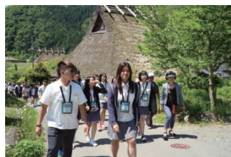
かやふきの里ガイドウォークの様子