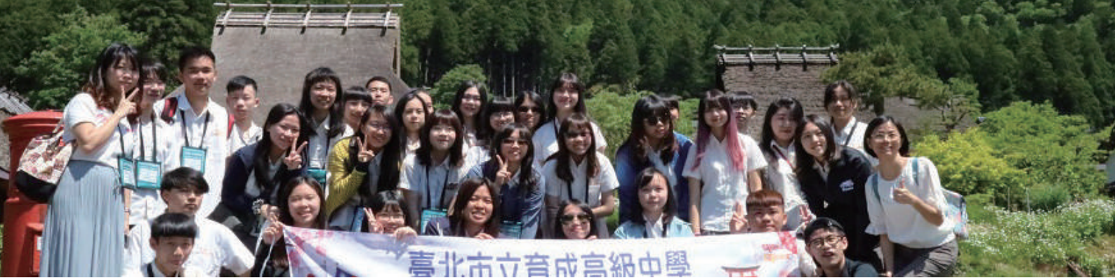
5月21-22日 台湾育成高校受入れの様子