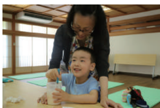
美山牛乳アイスクリーム作り体験

7月21日～8月26日の期間中、京都丹波高原国定公園ビジターセンターにて夏の体験講座を実施しています。ストーンペイントやわら細工など美山の講師をお招きして様々なワークショップを行いました。当日参加できるこの企画は、好評につき秋も実施予定していますのでぜひ遊びに来てください。