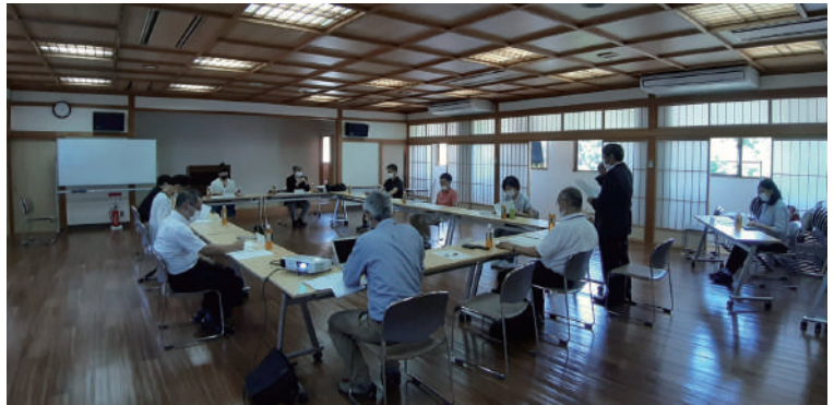
第1回美山町観光ビジョン策定委員会の様子