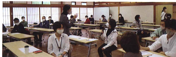
接客マナー講座実技練習の様子

受講者からは「実際の応対に近い具体的な内容で有意義な勉強ができた」「対応時の言葉遣いが参考になった」などの感想が寄せられ、今回の研修がお客様対応の更なるスキルアップにつながることを期待します。