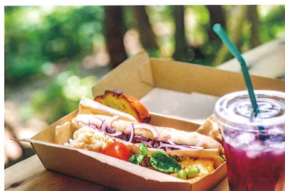
ランチボックス一例