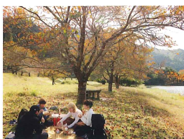
ピクニックランチの様子

本プランは11月30日まで実施いたしますので、ご友人、ご親戚の方々にぜひおすすめしてみてください。