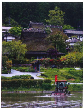
4月入賞作品 「里の田植え準備」