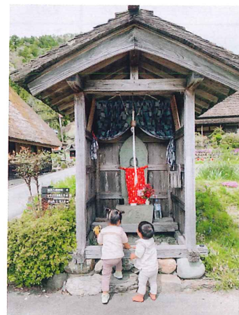
5月入賞作品 「大きくなりました♡」