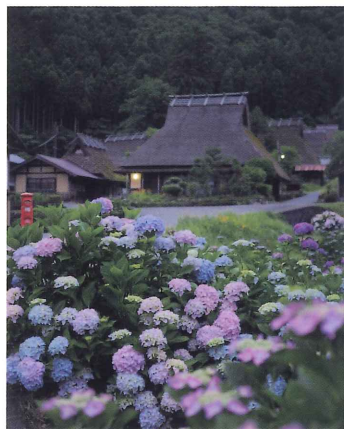
6月入賞作品 「紫陽花咲く 夕暮れ時の里山」

現在開催中の美山Instagramフォトコンテスト。6月・7月の季節賞各3点が決定しました。作品は美山ナビやInstagram、かやぶきの里の情報発信館ゆらりでご覧いただけます。美山町にお住まいの皆様からも美山の魅力が伝わる素敵な作品のご応募をお待ちしております！