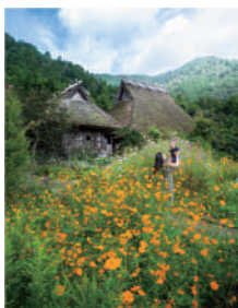
咲いたコスモス、 笑顔も咲いた