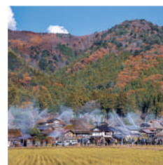
美山かやぶきの里 秋の一斉放水点検