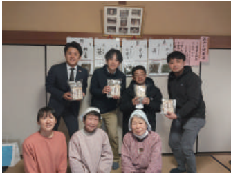
モニターツアー 健康茶づくり体験