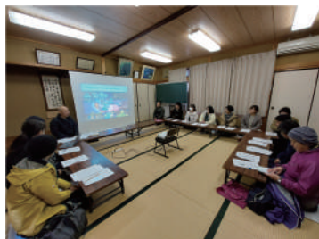
かやぶきの里 景観保全の取り組み講座

当協会では来訪者と地域をつなぐ役割を担う「美山観光コンシェルジュ」の養成に取り組んでいます。美山町は観光庁が取り組む「何度も地域に通う旅、帰る旅」という新たな旅のスタイルの普及・定着を図る『第2のふるさとづくりプロジェクト』の実証地域として2年連続で採択されており、その事業の一環として実施しました。1月に今回で3回目となる美山観光コンシェルジュ養成講座を実施しました。9日には伊根町で視察研修を行い、観光案内所や昨年9月にオープンしたばかりの空き家を改装した交流施設伊根の杜の見学、大学生との交流によって農業の活性化に取り組む本庄地区に関する講座を受講し、伊根町での観光の取り組みについて学びました。18日には美山の観光の中心地であるかやぶきの里を訪れ、(有)かやぶきの里や保存会の皆様にご協力いただき、施設の見学やガイドツアー、景観保全の取組に関する講座を実施。今後のご案内に活かせるよう、施設の特色や営業情報、そしてかやぶきの里で30年に渡り行われてきた景観保全と観光の両立に向けた取り組みについて学びました。