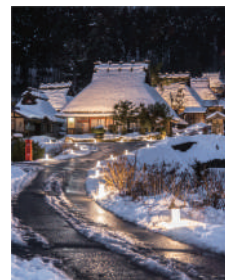
美山の冬の風物詩