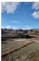
（左）電線類が 地中化された町並み （右）棚田の風景