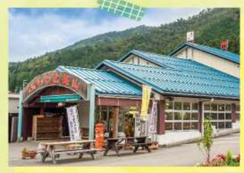
道の駅美山ふれあい広場 ☎ 0771-75-1906 (美山町観光案内/水曜定休) ☎ 美山町安掛下23