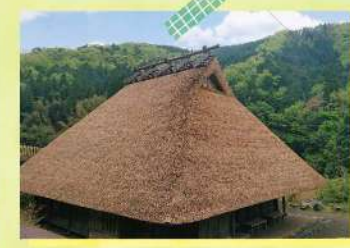
石田家住宅 ☎ 0771-75-9110 (大野振興会) 🕒 10:00～16:00 ☎ 美山町極原 🕒 平日、12月～3月 見学科 無料