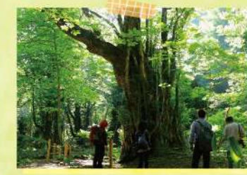
芦生の森 ☎ 0771-75-1906 (美山町観光案内/水曜定休) ☎ 美山町芦生弁蛇1 ※ 入林には申請書の提出が必要