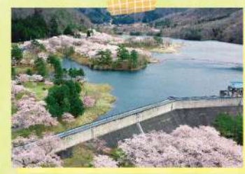
大野ダム ☎ 0771-75-0143 ☎ 美山町極原中野山41-2 🕒 大野ダムビジターセンター 4月～11月9:30～17:00 / 12月～3月9:30～16:30