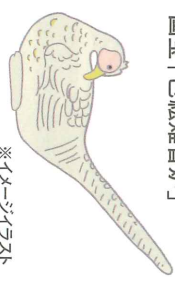
※イメージイラスト

野々村仁清誕生之地 陶芸家「野々村仁清」は、江戸時代に活躍した京都の焼き物の元祖。現在、数々の作品が国宝とされています。