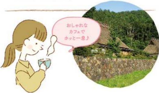
おしゃれなカフェでホットー息!

築150年のかやぶき民家を再活用した「美山かやぶき美術館・郷土資料館」。春から秋にかけて絵画やガラス、陶芸など作品の入れ替え展示を行っており、いつ訪れても新たな作品と出会えるおすすめスポットです。周辺エリアにはカフェやお食事ところが点在しており、アートを楽しんだ後に美味しいごはんをお楽しみいただけます。